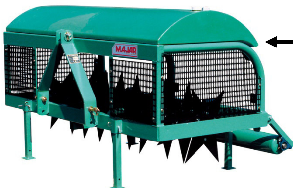
AEROVERT 180 C2 + ANCUVE 180 + RR180