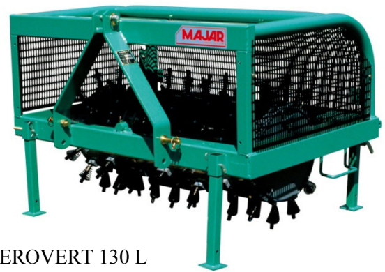
AEROVERT 130 L