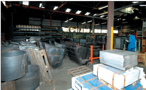
● L'un des aspects du métier de Majar consiste à entreposer d'innombrables références d'acier, à le découper, l'usiner, le souder, le peindre...

L'un des événements marquants de la saison 2005 est constitué par le lancement de la gamme Oxane, développée pour proposer des accessoires spécifiques aux quads, un