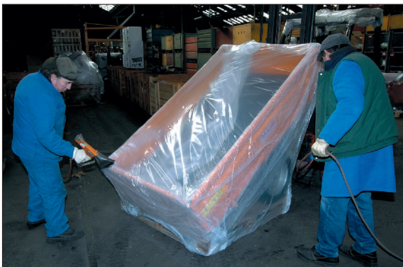
● Avant expédition, les remorques sont soigneusement emballées.

marché encore en développement, en particulier pour les engins à vocation utilitaire.