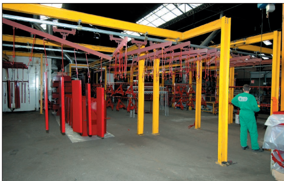
● Depuis 1999, l'usine de Carcassonne s'est dotée d'une ligne de peinture ultra moderne.