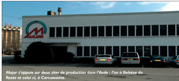
Majar s'appuie sur deux sites de production dans l'Aude : l'un à Belvèze du Razès et celui ci, à Carcassonne.

saisonniers, dans un premier temps uniquement sur la production de charrues. Progressivement l'offre s'est élargie, au rythme d'une extension de gammes tous les deux ans, la plus récente étant le lancement en 2005 du programme Oxane destiné aux quads. Mais les autres secteurs ne sont pas en reste : au total, le catalogue 2005 compte pas moins de 20 nouvelles références.