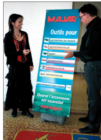
● Bien utile notamment pour animer les journées portes ouvertes, la PLV Majar est constituée de kakemonos sur support autonome mobile.

double essieu avec une charge utile respectivement de 700 kg et 800 kg. A cela s'ajoute le châssis porteur de 170 x 57 cm à simple ou double essieu (700 et 800 kg de charge utile), recevant en option une caisse de 170 x 112 cm ou des bras rangers de 50 cm de hauteur. Le clou de cette gamme est la remorque monobloc double service : dotée d'une caisse de 222 x 121 x 30 cm portée par un essieu, elle offre une charge utile de 335 kg, et peut s'atteler derrière une voiture (poids total en charge : 500 kg) pour porter le quad, et derrière ce dernier une fois arrivé sur le lieu de travail.