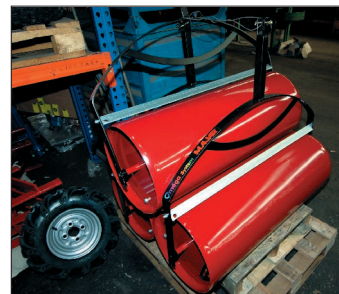
● Chez Majar, on pense qu'un outil peut aussi être élégant : progressivement les références passent entre les mains d'un designer spécialiste en esthétique industrielle.

La gamme est constituée de deux rouleaux tractés de 40 cm de diamètre, en 130 et 180 cm de largeur, d'un épandeur de 260 l de capacité à éjection réglable droite ou gauche, et de remorques. Une caisse de 120x80x40 simple essieu de 400 kg de charge utile, et deux caisses de 170 x 120 x 35 et 200 x 120 x 35, déclinées en version simple et