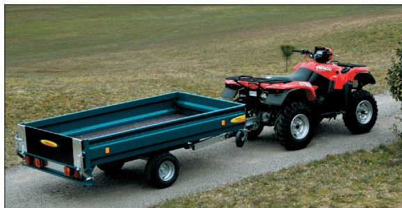
Fleuron de la gamme Oxane, la remorque monobloc double service est conçue pour s'accrocher à une voiture pour porter le quad jusqu'au lieu de travail, puis être attelée à ce dernier.